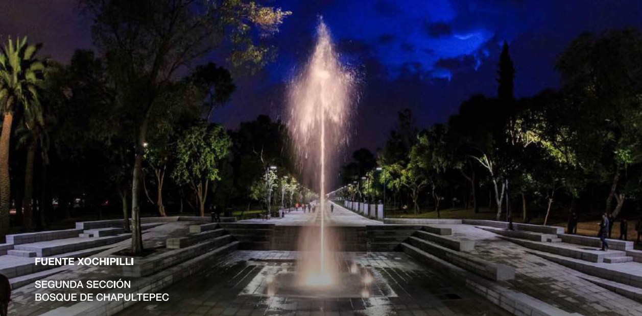
FUENTE XOCHIPILLI SEGUNDA SECCIÓN BOSQUE DE CHAPULTEPEC