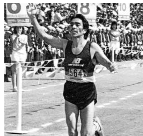
ACUARIO 40 años del maratón de la Ciudad de México 17 de julio al 24 de septiembre