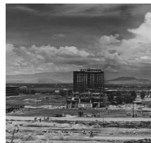
JUVENTUD HEROICA Ciudad Universitaria, UNAM 70 años de historia, 24 de julio al 2 de octubre