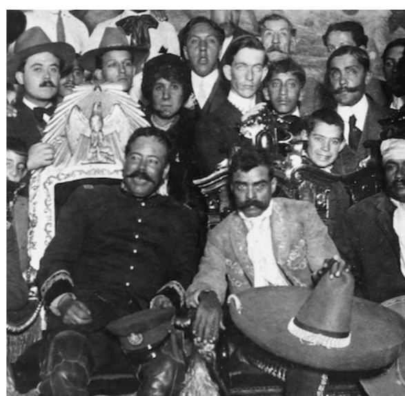
GRUTAS El ocaso del caudillo Del 17 de julio al 3 de septiembre