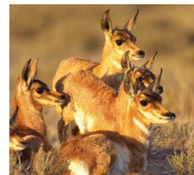
CALZ. DE LOS COMPOSITORES Totocalli. Imágenes para la conservación 6 de abril al 9 de julio