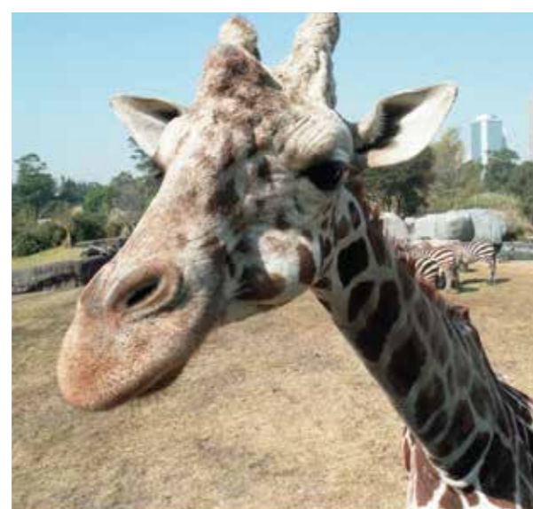
ACUARIO Zoológico de Chapultepec Alfonso L. Herrera, 100 años haciendo historia 6 de abril al 9 de julio

GALERÍAS ACUARIO, GRUTAS Y GANDHI ABIERTAS LAS 24 HORAS, GALERÍA JUVENTUD HEROICA ABIERTA DE 6 A 18 HORAS