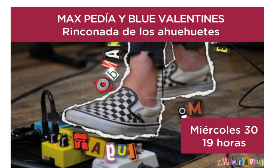
MAX PEDÍA Y BLUE VALENTINES Rinconada de los ahuehuetes