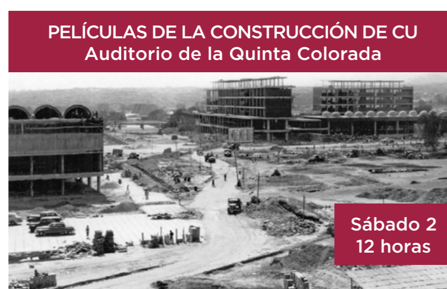
PELÍCULAS DE LA CONSTRUCCIÓN DE CU Auditorio de la Quinta Colorada