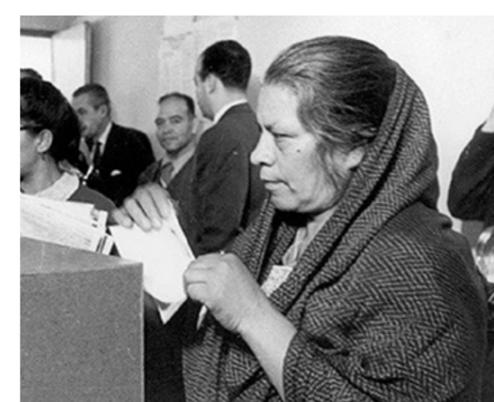
GANDHI 70 aniversario del voto de las mujeres en México Del 11 de septiembre al 29 de octubre