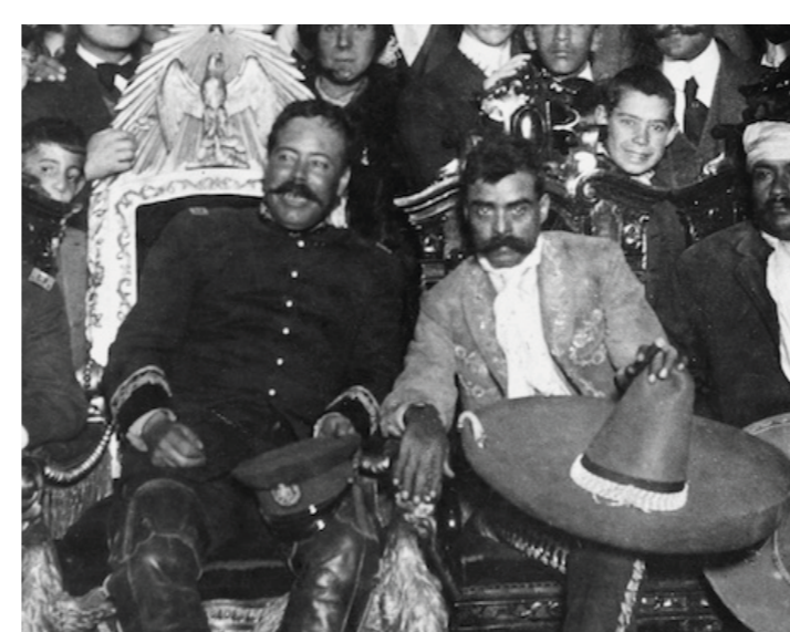
GANDHI El ocaso del centauro Del 17 de julio al 3 de septiembre