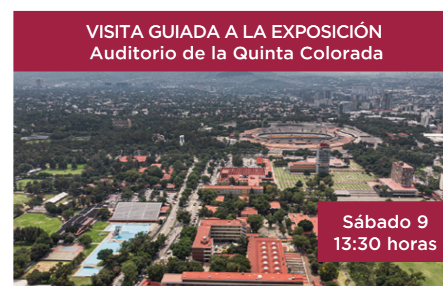
VISITA GUIADA A LA EXPOSICIÓN Auditorio de la Quinta Colorada