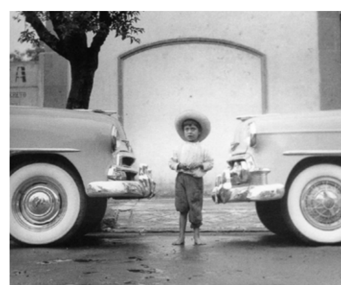
GRUTAS Ciudadanos. A cien años del natalicio de Héctor García Cobo 21 de agosto al 22 de octubre