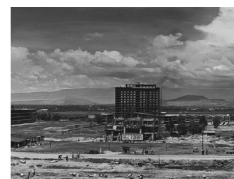
JUVENTUD HEROICA Ciudad Universitaria, UNAM 70 años de historia 24 de julio al 2 de octubre