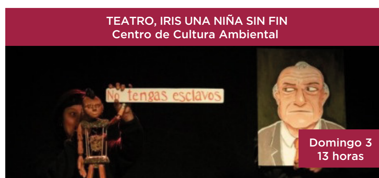
TEATRO, IRIS UNA NIÑA SIN FIN Centro de Cultura Ambiental