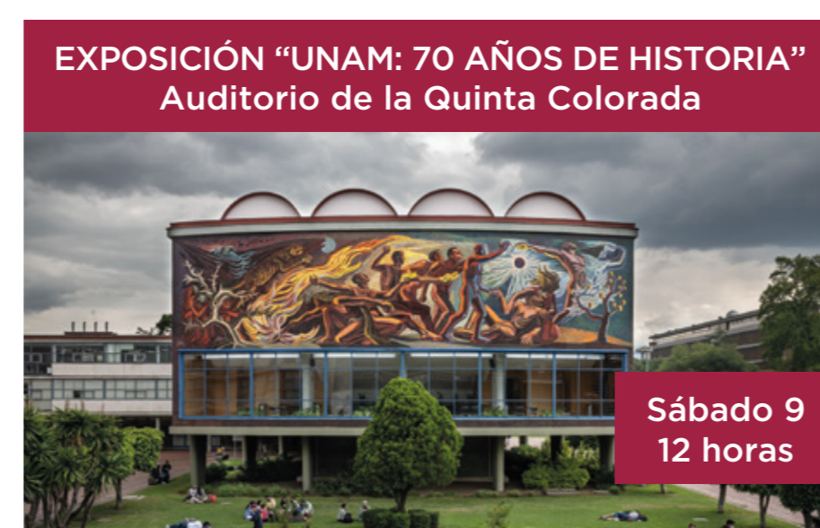
EXPOSICIÓN "UNAM: 70 AÑOS DE HISTORIA" Auditorio de la Quinta Colorada