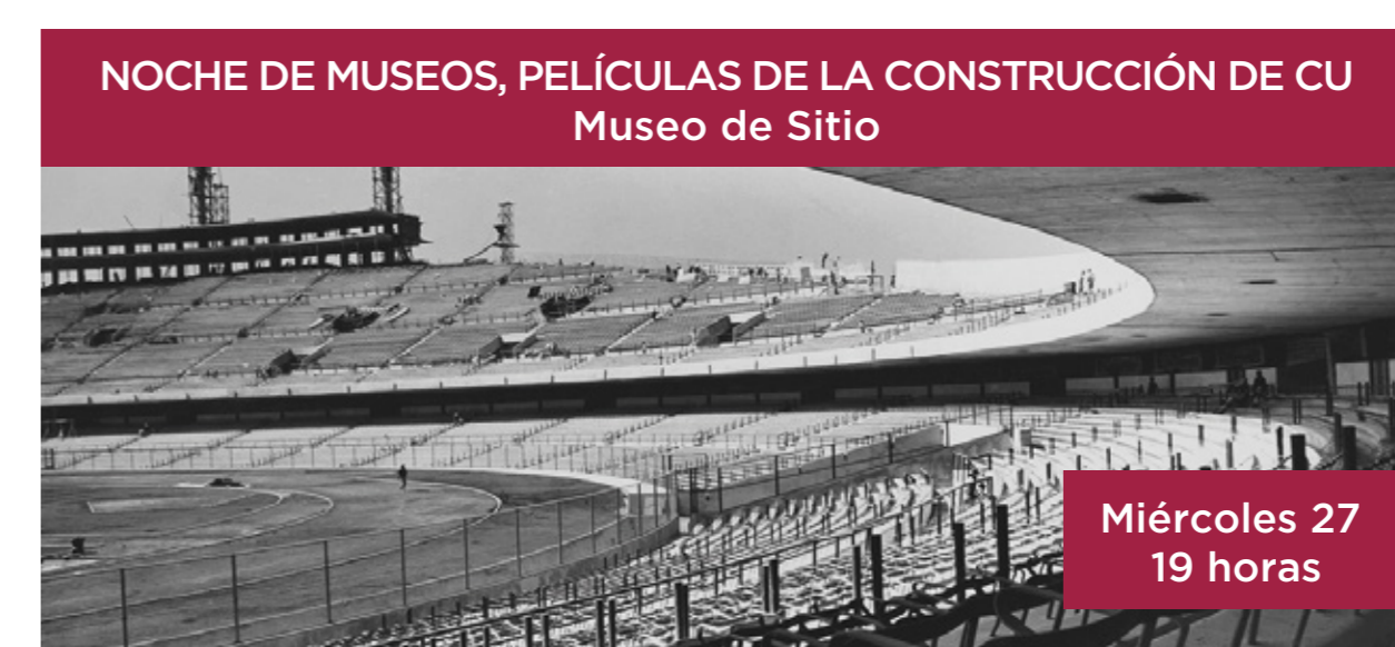
NOCHE DE MUSEOS, PELÍCULAS DE LA CONSTRUCCIÓN DE CU Museo de Sitio