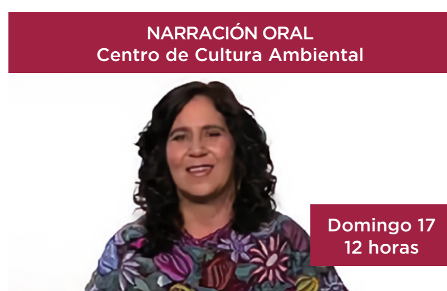
NARRACIÓN ORAL Centro de Cultura Ambiental