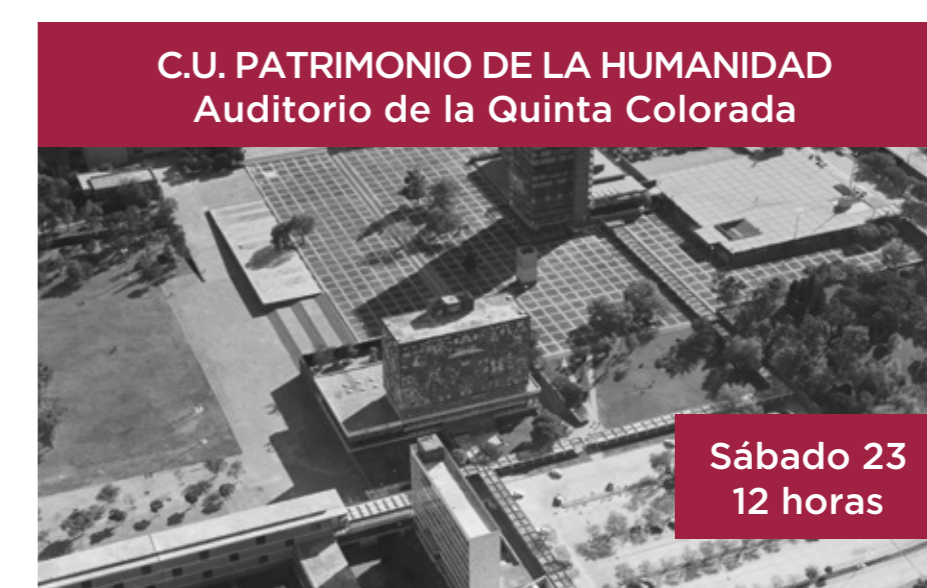
C.U. PATRIMONIO DE LA HUMANIDAD Auditorio de la Quinta Colorada